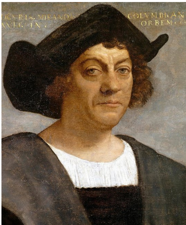
Энрике (Генрих) Мореплаватель